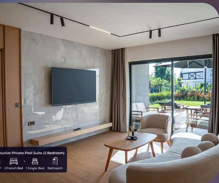
Executive Private Pool Suite (2 Bedroom) 62 m 2 2 French Bed 1 Single Bed Bathroom