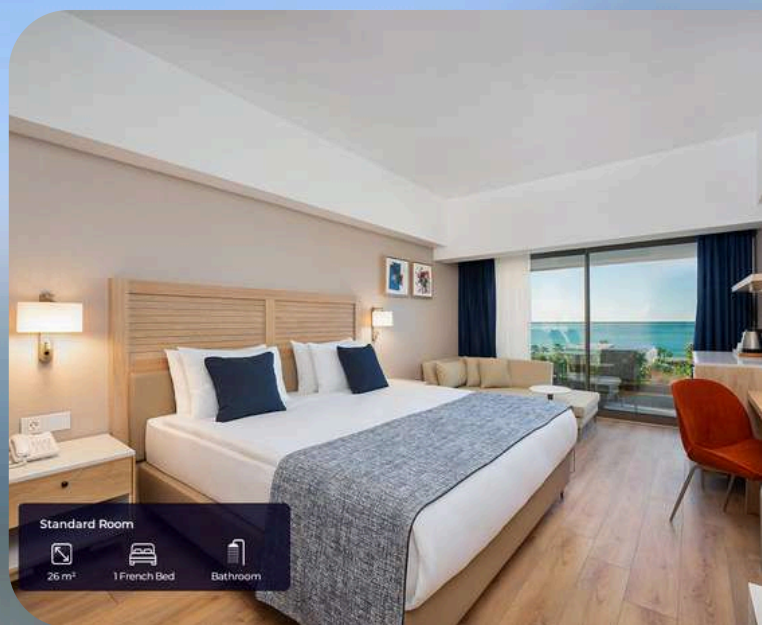
Standard Room 26 m 2 1 French Bed Bathroom