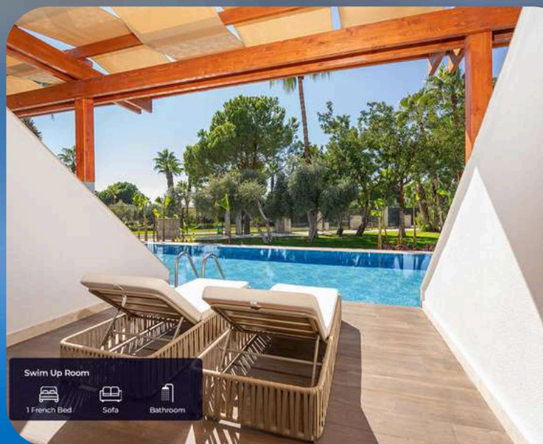
Swim Up Room 1 French Bed Sofa Bathroom