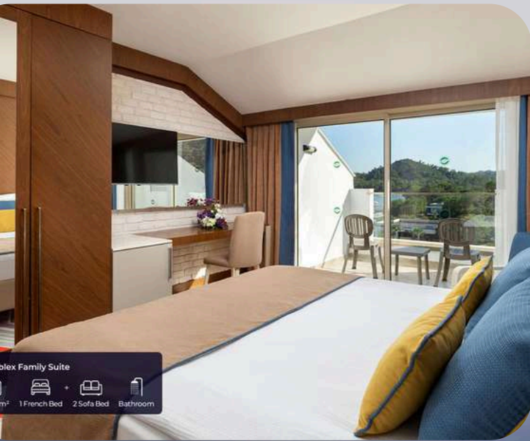
Deluxe Family Suite 38 m 2 1 French Bed + 2 Sofa Bed Bathroom