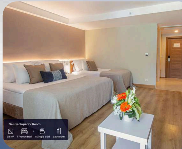
Deluxe Superior Room 38 m 2 1 French Bed + 1 Single Bed Bathroom