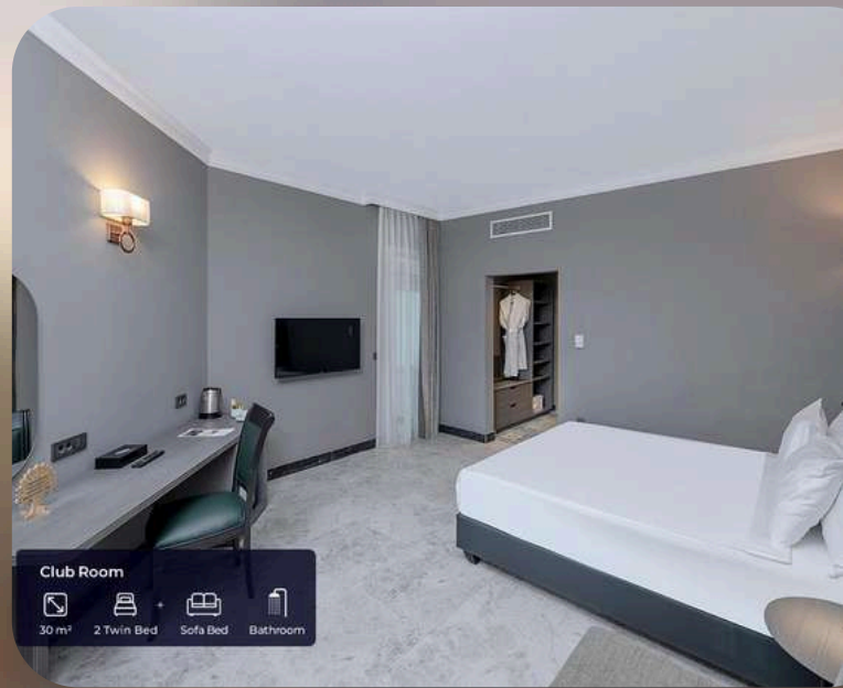
Club Room 30 m 2 2 Twin Bed + Sofa Bed + Bathroom