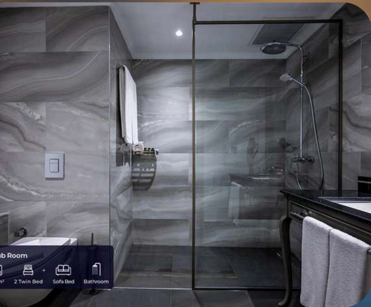
Club Room 30 m 2 2 Twin Bed + Sofa Bed + Bathroom